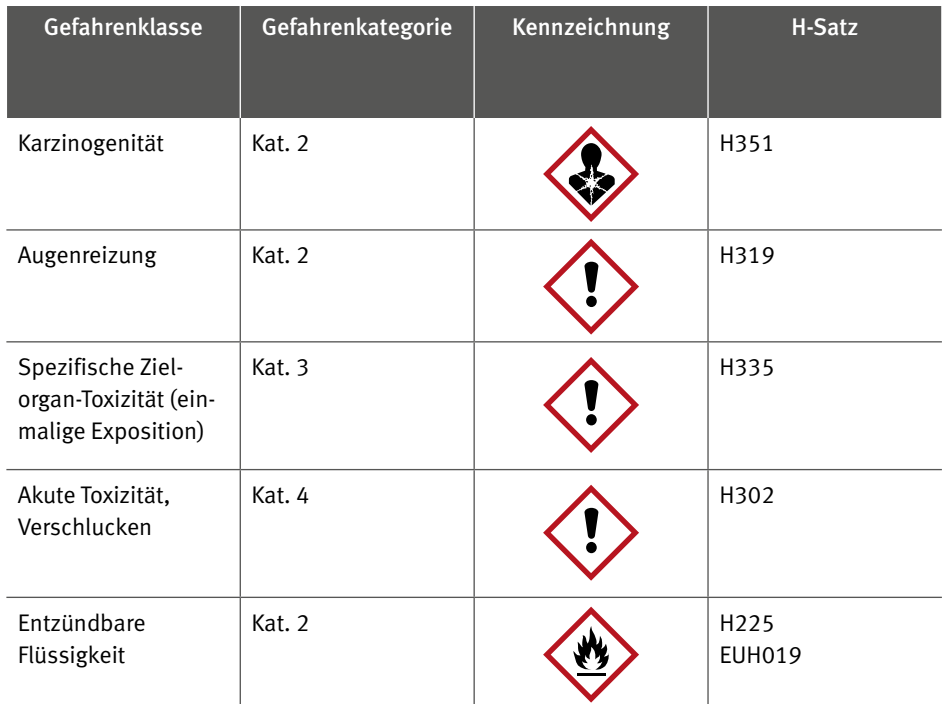
Tabelle 1: Einstufung und Kennzeichnung von THF nach CLP-Verordnung*

Nach der Verordnung (EU) 1272/2008 zur Einstufung und Kennzeichnung von Chemikalien (CLP-Verordnung) ist THF als Gefahrstoff eingestuft [10]. Zusätzlich ist THF mit dem Signalwort „Gefahr“ zu kennzeichnen.